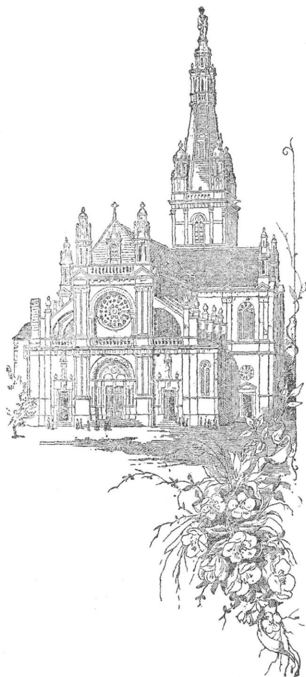
La Basilique actuelle.