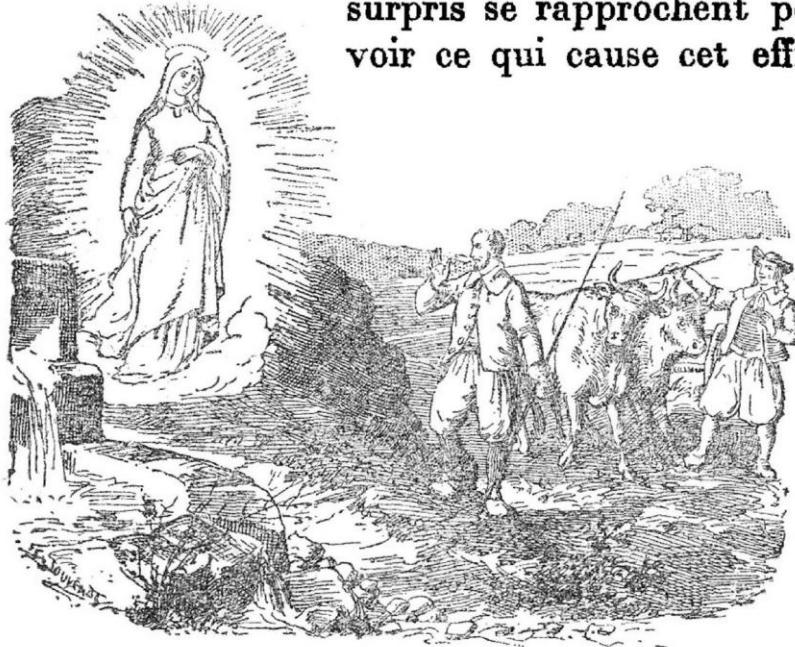
~~~~~ Première apparition de Sainte Anne.

Tout à coup, les bœufs comme épouvantés refusent obstinément d'avancer. Ces deux hommes surpris se rapprochent pour voir ce qui cause cet effroi.